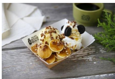
<メイプルシャック>