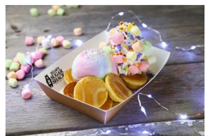
<ユニコーンベアー>