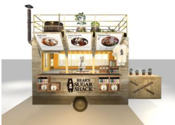
<フードトラック イメージ>